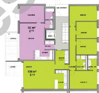
Plan type des appartements