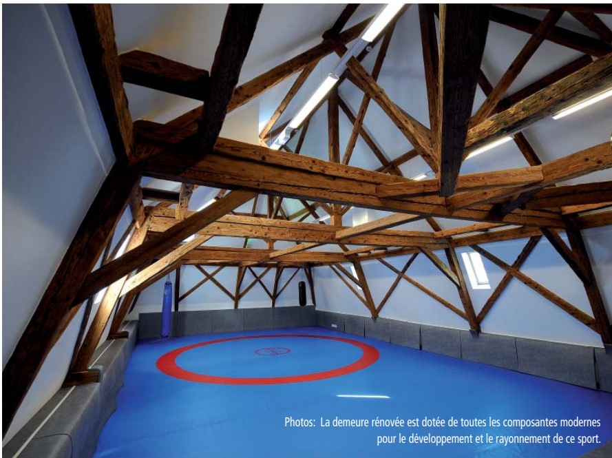
Photos: La demeure rénovée est dotée de toutes les composantes modernes pour le développement et le rayonnement de ce sport.