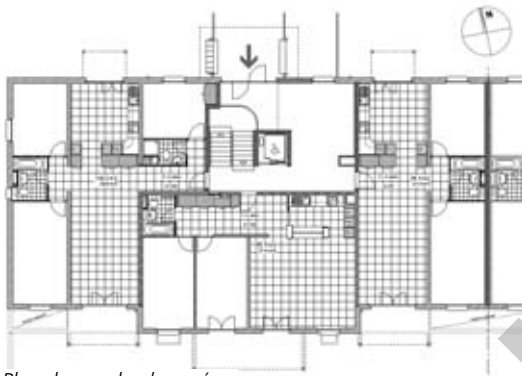
Plan du rez-de-chaussée

La conjonction de ces éléments permet de répondre de façon évidente aux objectifs du programme et détermine à la fois l'attrait pour les locataires et l'intérêt du propriétaire, apprécié sur le long terme.