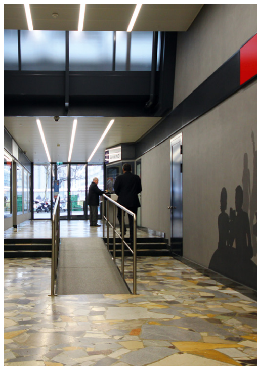
et après rénovation.