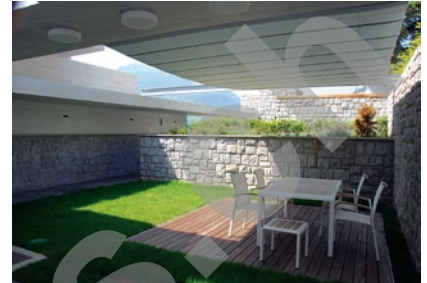
Photos: Terrasses, jeux de lumière, continuité des espaces intérieurs vers l'extérieur, lignes sobres, épurées, et matériaux bruts, identifient très clairement la villa en référence aux grands courants d'architecture du milieu du 20ème siècle.

Dans le respect de ces conditions de base, les techniques CVSE sont entièrement revues et adaptées aux exigences contemporaines en matière de rendement énergétique, d'économie et de confort.