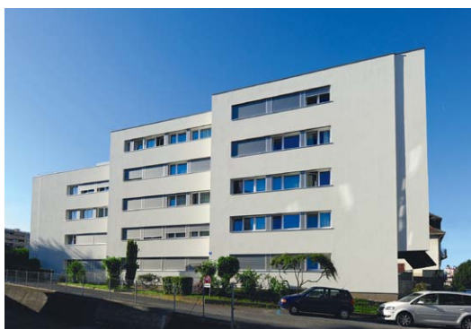
Image rafraîchie et modernisée. Le concept d'intervention résulte d'une étude qui tient compte des caractéristiques architecturales et fonctionnelles du bâtiment. Le ton clair des façades contraste avec les bandes de fenêtres d'une part et avec les parapets de balcons en béton lavé préfabriqué d'époque sur l'autre face du bâtiment. Ces touches sont utilisées comme une mise en évidence, pour améliorer l'image de l'édifice, parallèlement aux options techniques retenues en vue d'atteindre