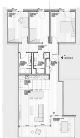
Rez supérieur, étage 1 et 2, type D