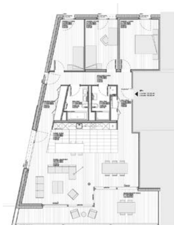
Rez supérieur, étage 1 et 2, type E

Conscient de la grande qualité du site inscrit dans un paysage boisé, avec une vue exceptionnelle sur le lac et dans un quartier résidentiel calme, le bureau d'architectes a porté une grande attention au choix des matériaux. Le projet est composé de deux volumes qui s'imbriquent. L'un compact est ancré au sol. Le second est suspendu sur la façade Sud. Il s'élance sur le lac et contient les loggias. Sobre, le bâtiment est pensé avec un code couleur et des textures simples en harmonie à l'intérieur et à l'extérieur. L'élégance de la pierre naturelle claire choisie en façade Sud contraste avec la couleur brun chocolat du crépi fin au Nord. Des séparations de balcons en bois et des garde-corps en verre créent le rythme de la façade Sud. Le gris aluminium/inox pour les menuiseries en bois-métal, la serrurerie et les stores à lamelles.