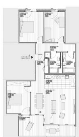
Rez supérieur, étage 1 et 2, type C