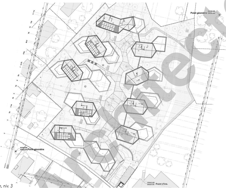
Plan de situation, niv. 3