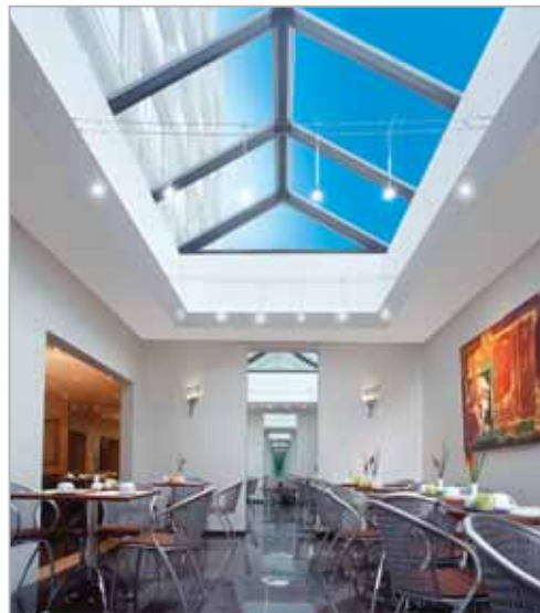
Salle de petit-déjeuner éclairé zénithalement

Pour le parage des véhicules, l'établissement dispose de 25 places couvertes côtés cour, réparties sur 3 niveaux et accessibles depuis la rue principale.