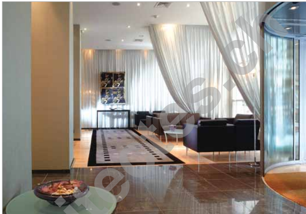
Le lobby dans son style design

BTE 2000 Chemin de l'Epinglier 1217 Meyrin bte2000@dplanet.ch