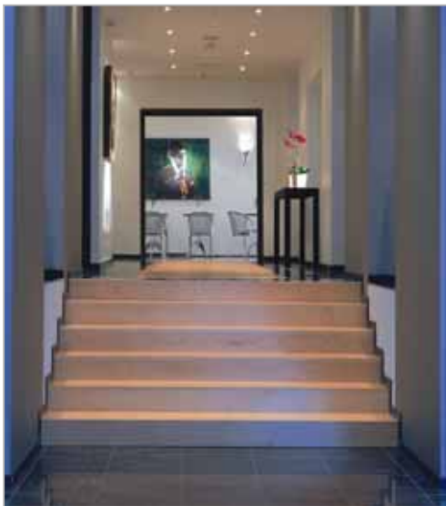
Vue face à l'entrée principale