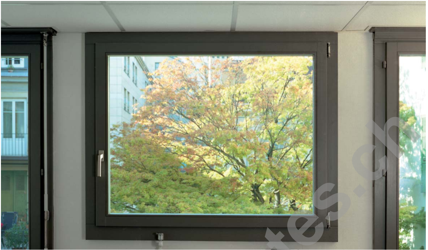
Photos: Construction relativement modeste, mais de belle facture, l'immeuble est destiné à un nouvel usage, après réflexion dans le respect des exigences formulées par le Service des Monuments Historiques.