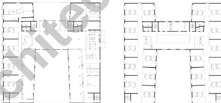
Etages 1 et 2