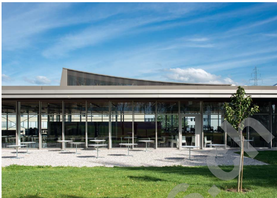
Restaurant - terrasse

Constructions et équipements: gain d'efficacité et d'énergie. L'architecture met en évidence la conception globale voulue pour le site, en présentant une composition cohérente, marquée dès l'abord par l'organisation des extérieurs.