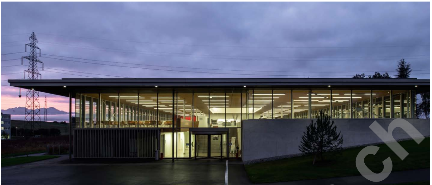
Restaurant - entrée

préfabriqué et doté d'une finition laquée et de perforations pour l'amortissement phonique. L'ensemble permet de limiter l'épaisseur et le poids propre du plancher, induisant des économies notables sur la structure et sur les fondations dans un terrain peu favorable.