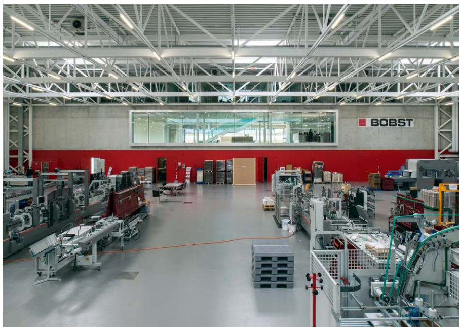
Bobst Group - Showroom