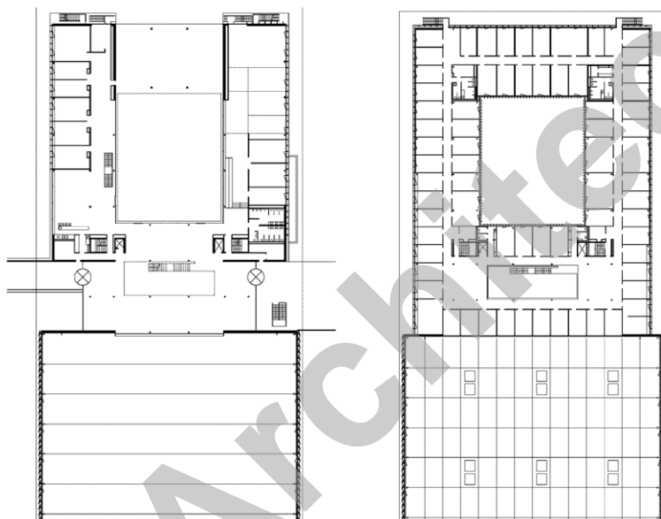
Bobst Group & Showroom - Rez et 1er étage

A partir de la route cantonale, où deux giratoires sont construits, la desserte du bâtiment Bobst Group est privilégiée pour les visiteurs alors que les camions accèdent directement aux halles et les collaborateurs à un parking de 1'800 places aménagé dans la forme et l'esprit d'un jardin. L'architecture paysagère crée le lien entre des bâtiments à l'architecture simple, voulue très horizontale est vitrée, pour s'intégrer au paysage et à la campagne. Le visiteur accède par une esplanade au grand hall d'accueil, visuellement prolongé par la "Promenade des Alpes", large allée piétonne, soulignée par un ruisseau artificiel, qui traverse le site sur 500 mètres, véritable trait d'union entre les diverses entités.