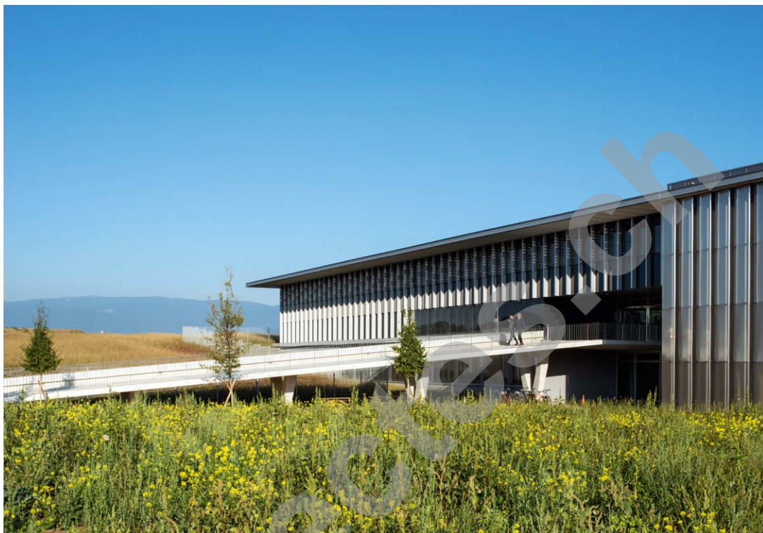
Bobst Group - Façade sud