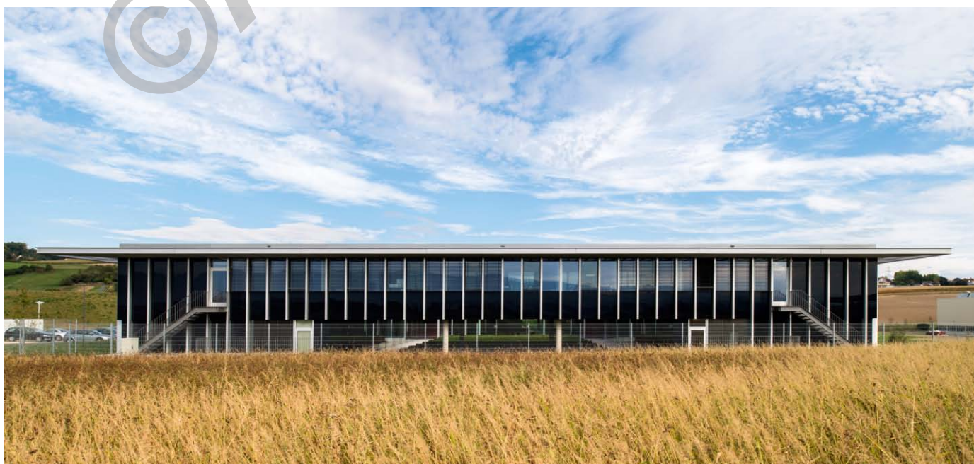
Bobst Group - Façade ouest