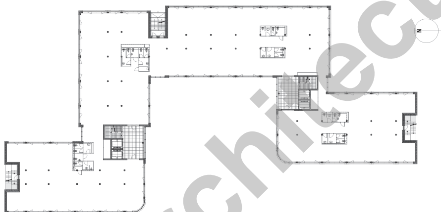
Plan d'étage type

La structure est composée de matériaux classiques, avec des dalles et murs en béton armé, des escaliers et piliers en préfabriqué, les façades métalliques sont isolées selon le label Minergie®. Le verre a été choisi pour ses valeurs thermiques et acoustiques haute performance.