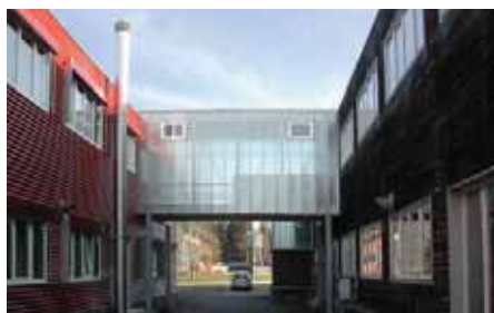
Passerelle façade sud-ouest