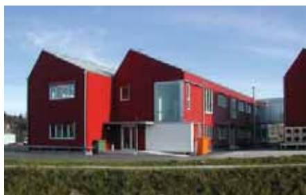
Vue arrière sud-ouest