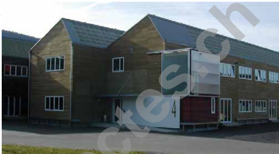
Pignon d'entrée nord-est