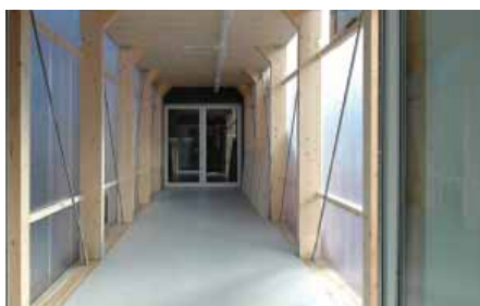
Vue intérieure passerelle

Un des premiers problèmes à résoudre fût la mise en place d'une nouvelle structure bois pour le plancher de l'étage (pouvant recevoir les mêmes charges que pour l'ancien détail) qui a été, pour permettre un gain de temps, entièrement préfabriqué en 36 éléments de 220 x 810 cm, composés de solives en bois et d'une dalle B.A. de 10 cm. Le tout, une fois mis en place et assemblé avec goujons et plaques métalliques est recouvert d'une chape et d'un revêtement en résine. Ce système remplace donc l'ancien qui était composé de planches clouées par éléments préfabriqués, d'une dalle B.A. de 14 cm coulée sur place, le tout recouvert d'un parquet.