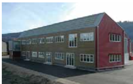
Façade long pan nord