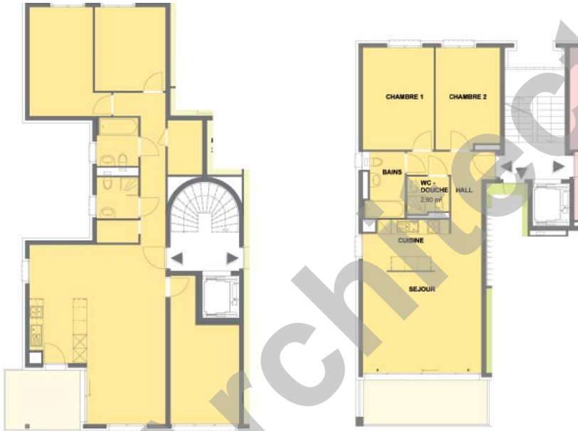
Bâtiment F, appartement 41/2 pièces