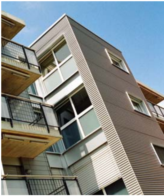
Plan du 1er étage