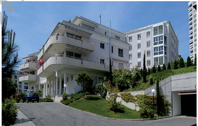
Rhodanie 64 C