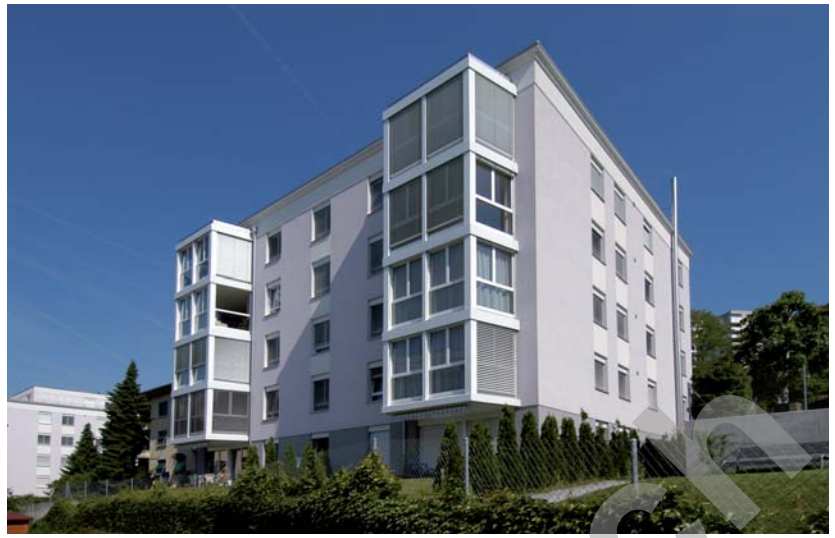
Figuiers 23 et 31