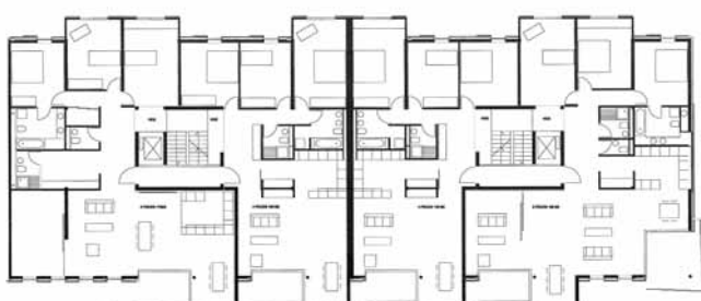
Niveaux 1, 2 et 3

pour les murs, plafonds en plâtre lissé, faux-plafonds pour les commerces, constituent les choix principaux. Les installations techniques du bâtiment, très développées, contribuent à fournir l'agrément d'ambiance et d'exploitation dont le niveau correspond aux exigences d'une construction moderne, destinée à la vente en PPE.