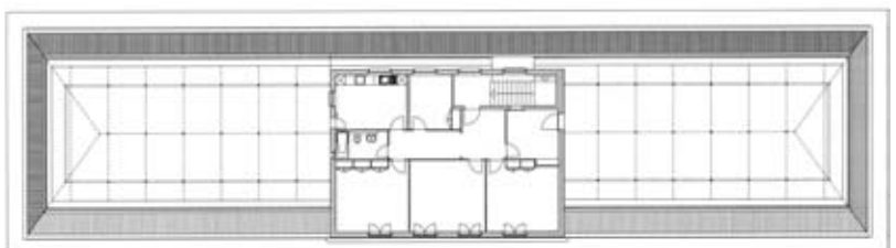
Plan des combles