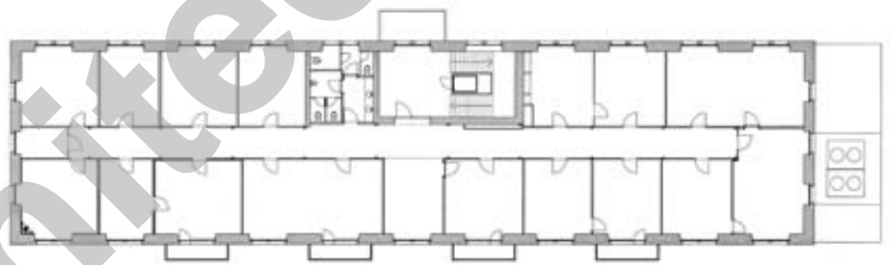
Plan du 1er étage