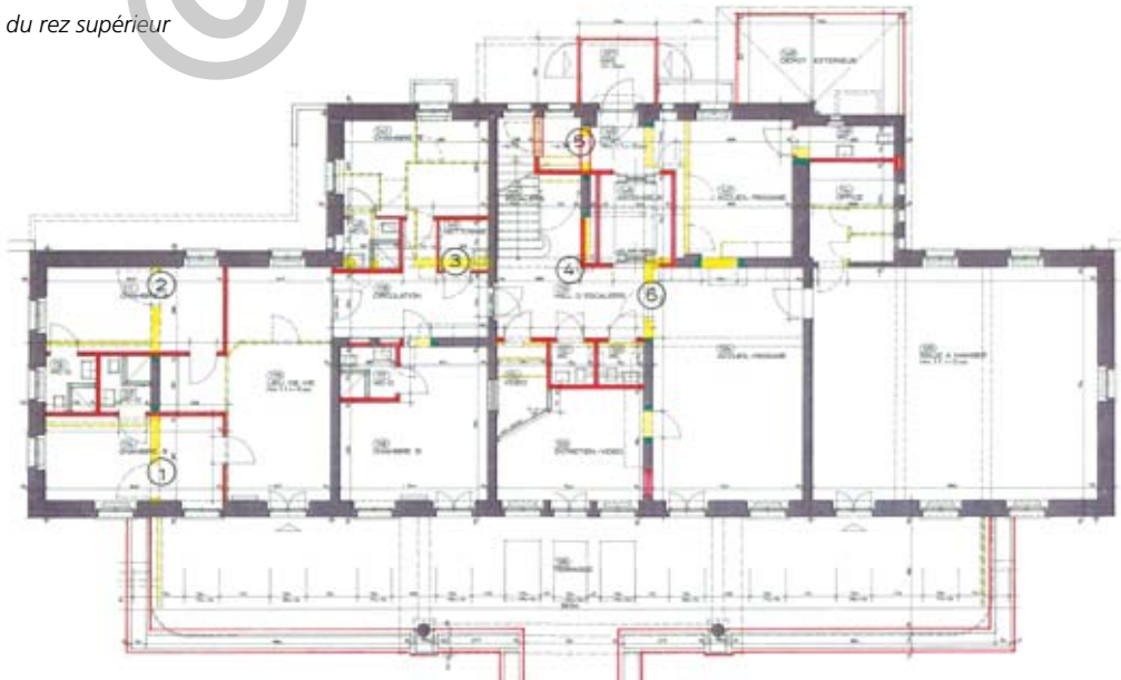
Plan du rez supérieur

1'468 m 2 , le programme prévoit 413 m 2 destinés aux chambres. Le solde des surfaces concerne des salles d'entretien/vidéo, les cuisines et laboratoires, salles d'eau et WC, la salle de soins/pharmacie, ainsi qu'un fumoir. 337 m 2 restent dévolus aux circulations et aux locaux techniques, tandis que les lieux de vie communs, séjours et salles de groupes occupent 360 m 2 . Le tout s'étage sur cinq niveaux, offrant une capacité totale de 21 chambres.