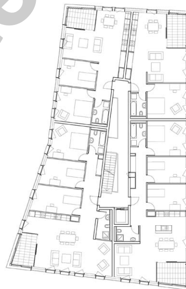
Plan type, bâtiment B