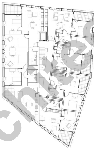
Plan type, bâtiment A