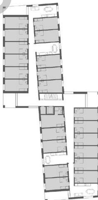
Plan étage type chambres