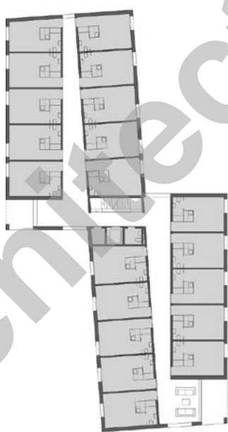
Plan étage type studio

PROJET > Large recours à la préfabrication. Chacune des quatre unités construites propose une affectation particulière. Le bâtiment A se divise en deux zones: au nord trente studios entièrement équipés et au sud, quinze