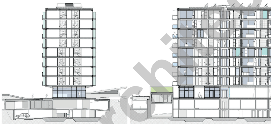
Coupe longitudinale (fragement gauche)

Les balcons s'étirent comme des coursives et structurent l'expression des façades. Les pleins et les vides, la disposition aléatoire des garde-corps opaques ou translucides, les mouvements des grands stores toile font vibrer cette masse immense. Le rythme est franc mais jamais répétitif, banal ou lassant.