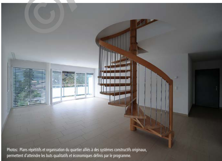
Photos: Plans répétitifs et organisation du quartier alliés à des systèmes constructifs originaux, permettent d'atteindre les buts qualitatifs et économiques définis par le programme.

Globalement, ce dispositif, qui s'inscrit dans un environnement préservé et dont l'organisation favorise le maintien permanent de la tranquillité, offre un cadre de vie attrayant pour un coût parfaitement compétitif, l'ensemble de l'opération visant à pratiquer des loyers moyens de quelque 200.-/m 2 /an, charges et garage non compris.