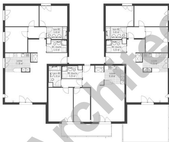
Plan du rez-de-chaussée, bât.D

puisse être réalisé en moins de deux ans, tout en gérant une organisation par étapes devant permettre aux locataires d'entrer dans leurs logements respectif, au fur et à mesure de la terminaison des bâtiments.