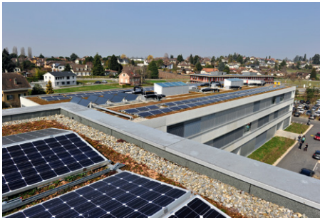
2) EPFL Innovation Park