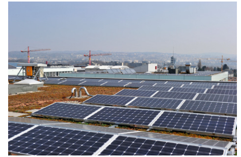
2) EPFL Innovation Park