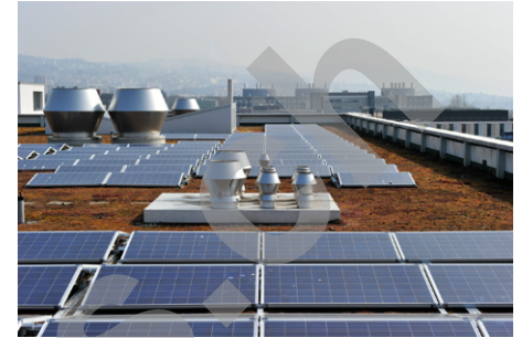
3) Sciences de la vie

1) Sur la toiture GC, des cellules mono-cristallines classiques ont été posées afin de compléter les zones résiduelles de la première étape, avec une puissance de 286 kW. Il s'agit d'une solution conventionnelle conforme à celle appliquée en première étape, lestée par gravier et dalles.