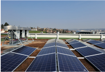
2) EPFL Innovation Park