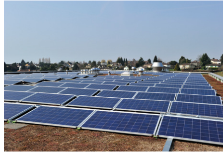
3) Sciences de la vie