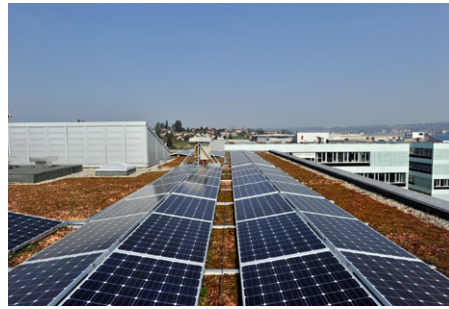
2) EPFL Innovation Park