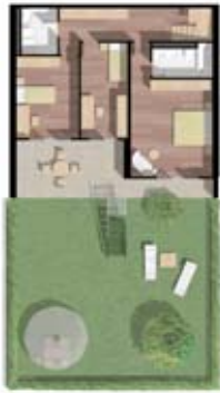
Duplex rez + étage