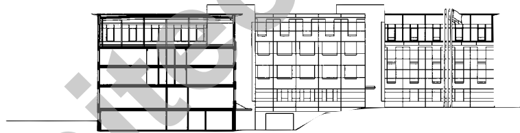
coupe A - A