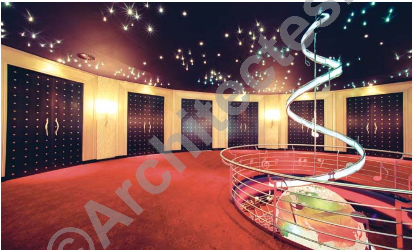
Vue 3D niveau supérieur