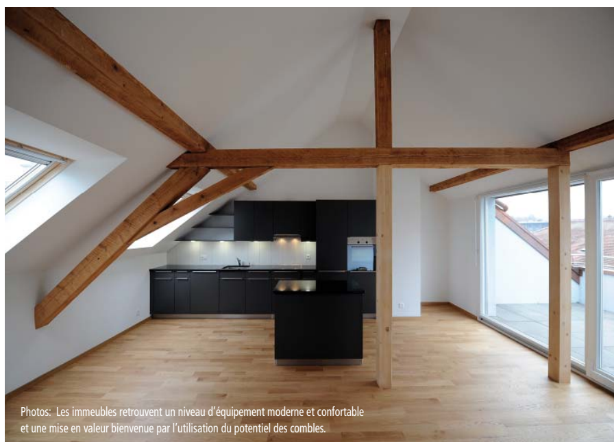
Photos: Les immeubles retrouvent un niveau d'équipement moderne et confortable et une mise en valeur bienvenue par l'utilisation du potentiel des combles.