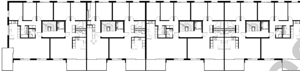
Plan d'étage type