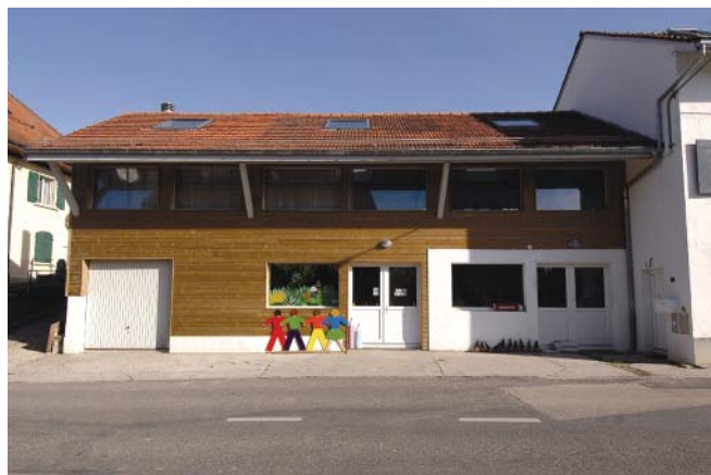
Vue côté rue après travaux