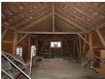
Partie jour avant travaux