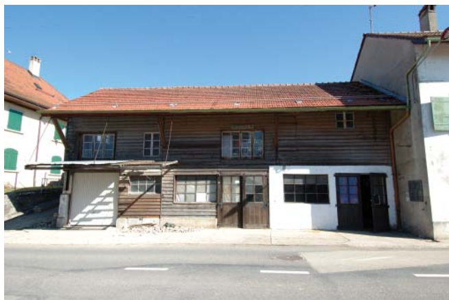
Ancienne forge, état existant

Le programme se compose d'une halte-jeux pour enfants d'âge pré-scolaire, de l'atelier d'architecture du propriétaire et du logement familial. La halte-jeux et l'atelier ont été disposés de plain-pied, avec accès direct depuis les places de parc réalisées en bordure de route. Le logement se situe dans les 2 niveaux supérieurs. Le séjour a été aménagé au-dessus des locaux de travail ainsi que de l'ancien pressoir, transformé en garage. Au vu de sa situation particulière au nord, de nombreuses fenêtres ont été disposées en façades est et ouest, complétées par 6 grands Vélux. Comme le volume existant était très généreux, la cuisine et le coin repas ont été intégrés à cet ancien dépôt. La rampe d'accès latérale a été conservée. Elle permet la liaison du séjour à l'extérieur. Le maximum d'éléments originaux intéressants ont été conservés, particulièrement dans les chambres existantes des combles ainsi que dans l'ancien séjour, réhabilité en chambre d'enfant. Les planchers ont été soigneusement déposés, triés et reposés dans les locaux sanitaires. Les escaliers extérieurs situés en façade sud ont été supprimés afin de gagner en sécurité, la première marche était en bordure de route, et en intimité, la terrasse devenant ainsi privative.