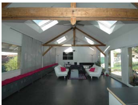
Après travaux, luminosité maximale