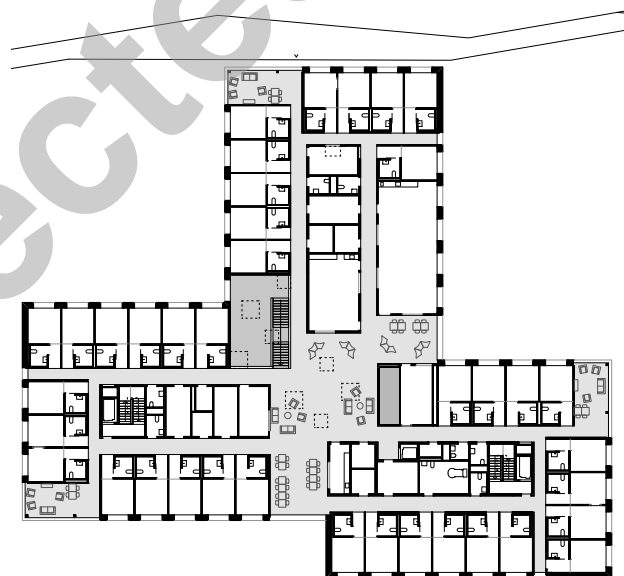
Plan du 2 ème étage