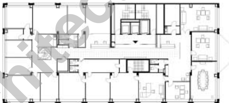
Plan de l'étage