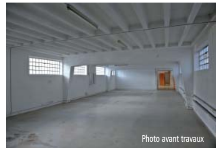
Photo avant travaux

affectation, la toiture est isolée et étanchée, les façades reçoivent une isolation périphérique, polystyrène et laine minérale sur zone courives.