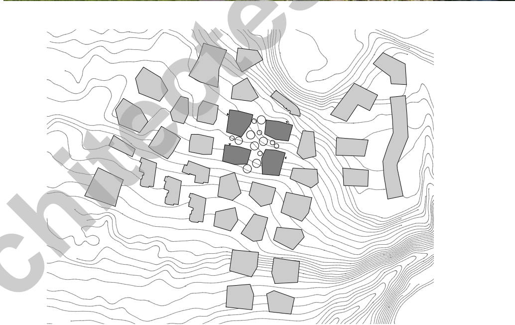
Plan de situation

Les façades sont réalisées en crépi minéral épais laissant respirer la peau et lui conférant un aspect changeant en fonction de l'humidité ou du soleil. Ces panneaux crépis reçoivent une texture verticale brossée d'une seule main permettant d'accrocher la lumière, notamment avec le soleil du matin et du soir.