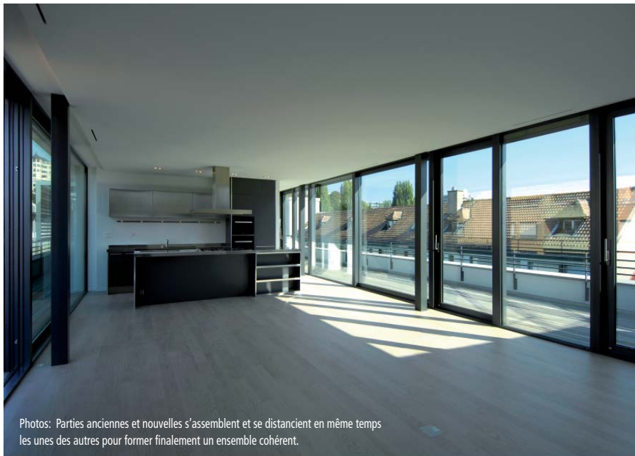
Photos: Parties anciennes et nouvelles s'assemblent et se distancient en même temps les unes des autres pour former finalement un ensemble cohérent.