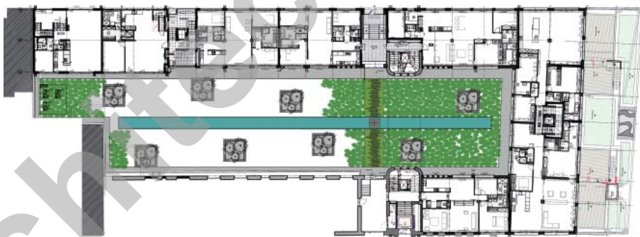
Plan du rez supérieur