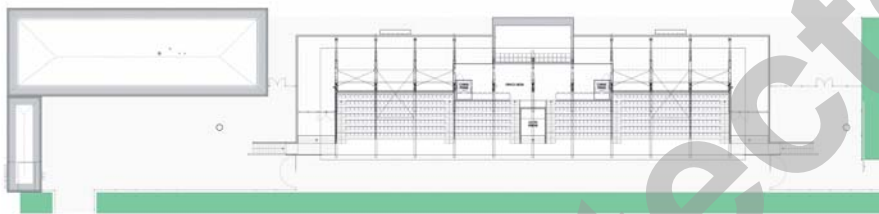
Plan du 1er étage

L'ensemble du projet va donc à la rencontre d'un programme exigeant sous plusieurs aspects, intégration, architecture, réserve d'évolution, image marquante et satisfaction aux attentes sportives aussi bien que politiques.