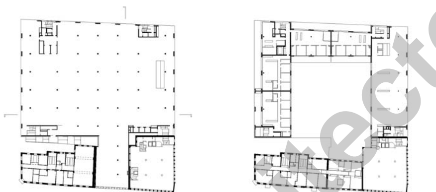
Plan des niveaux 1 et 3