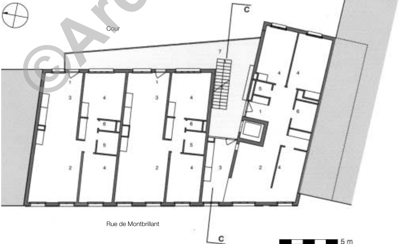
Plan étages 1 à 3