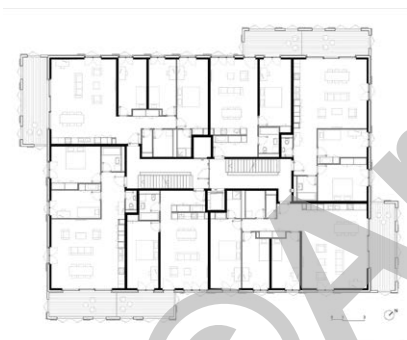
Plan étage type