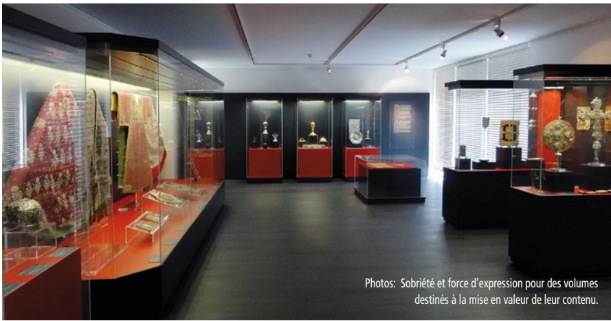
Photos: Sobriété et force d'expression pour des volumes destinés à la mise en valeur de leur contenu.