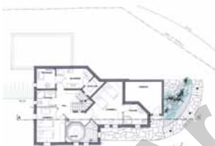
Plan du rez-jardin