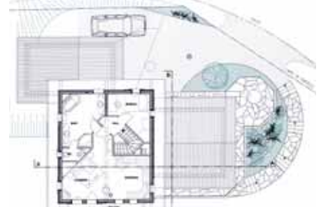
Plan de l'étage