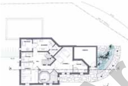
Plan du rez-jardin