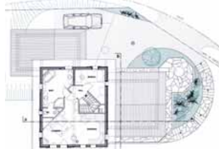
Plan de l'étage