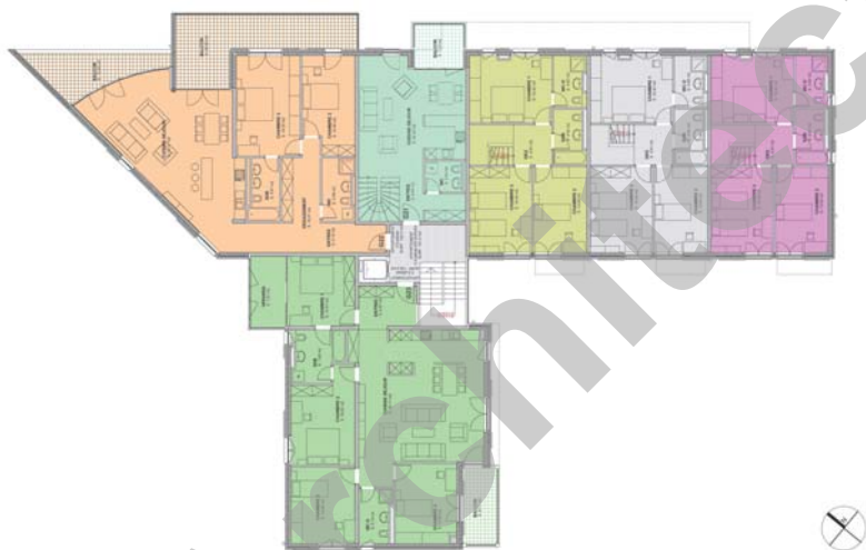
Bâtiment G, niveau 2

D'allure semblable, les deux bâtiments projettent une image adaptée à leur situation sur le site et réservent des aménagements intérieurs nettement différenciés.