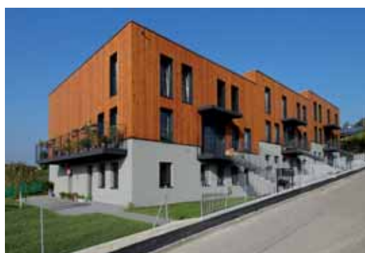
Image nette, à la fois sobre par ses lignes et chaleureuse par ses matériaux: l'immeuble s'inscrit dans la ligne des réalisations typiquement contemporaines.