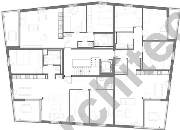
Plan d'étage type

dans l'écrin de verdure et de paix dont dispose le terrain. Ainsi, une grande partie des appartements bénéficie d'une vue dégagée sur les Préalpes.