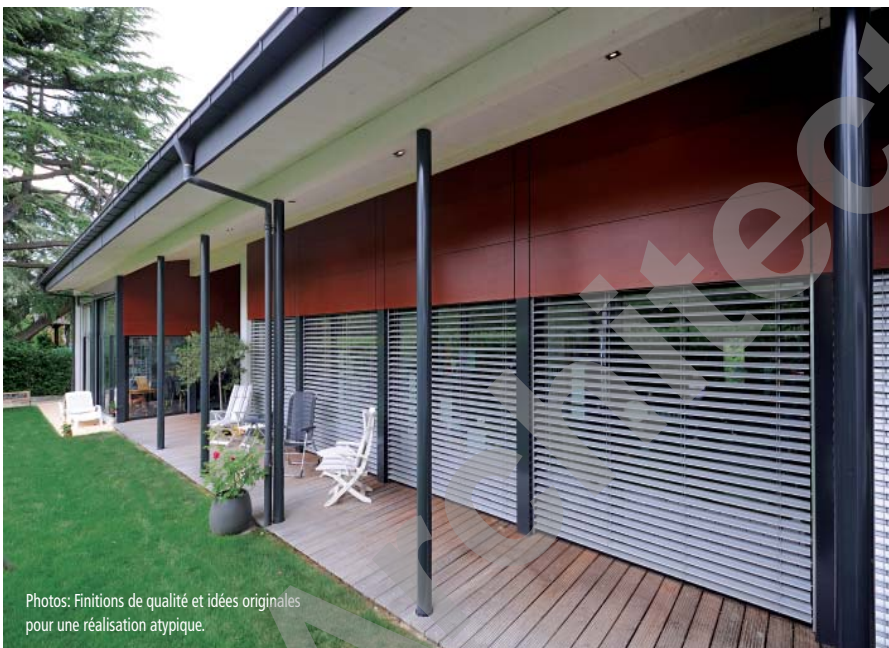
Photos: Finitions de qualité et idées originales pour une réalisation atypique.

Garages et atelier sont également réalisés en éléments préfabriqués monolithiques. En façade, on a appliqué des panneaux stratifiés en bois à haute densité pour l'extérieur, de type Parklex.