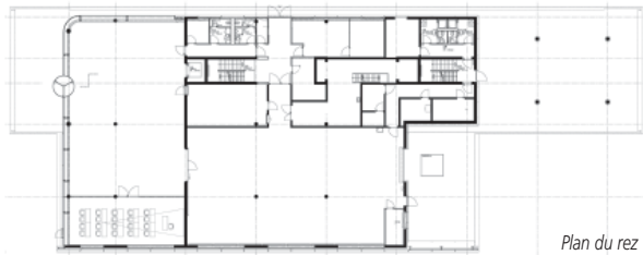
Plan du rez

A l'extérieur, espaces verts et zones de circulation pour la livraison sont protégés de l'autoroute par un talus végétalisé, lequel assure également une protection phonique. La réalisation a été menée à bien dans un temps record, en prenant soin de respecter l'identité de la société Fanuc jusque dans les plus petits détails, de concert avec les mandataires internationaux.