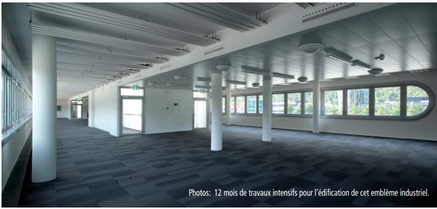
Photos: 12 mois de travaux intensifs pour l'édification de cet emblème industriel.