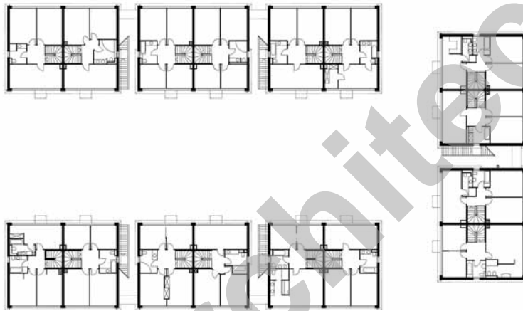
Plan des étages

Ce dernier est poursuivi visuellement à l'extérieur par une marquise métallique qui incorpore les stores à lamelles et les stores toiles, permettant de réguler l'afflux de lumière naturelle.