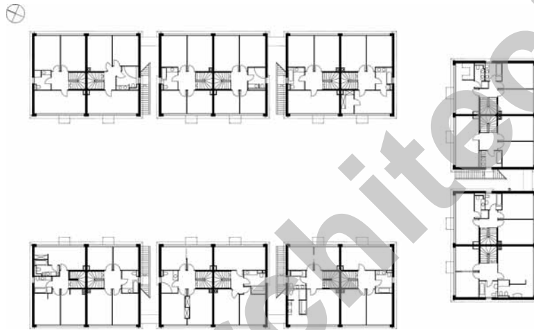
Plan des étages

Ce dernier est poursuivi visuellement à l'extérieur par une marquise métallique qui incorpore les stores à lamelles et les stores toiles, permettant de réguler l'afflux de lumière naturelle.