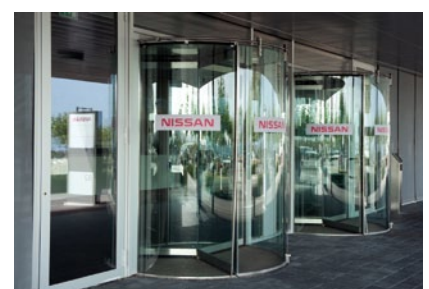
Photos: Concept global de signalétique, mobilier urbain dessiné par le bureau d'architecte et éclairage confèrent à l'ensemble une unité esthétique de grande qualité contemporaine et unique.