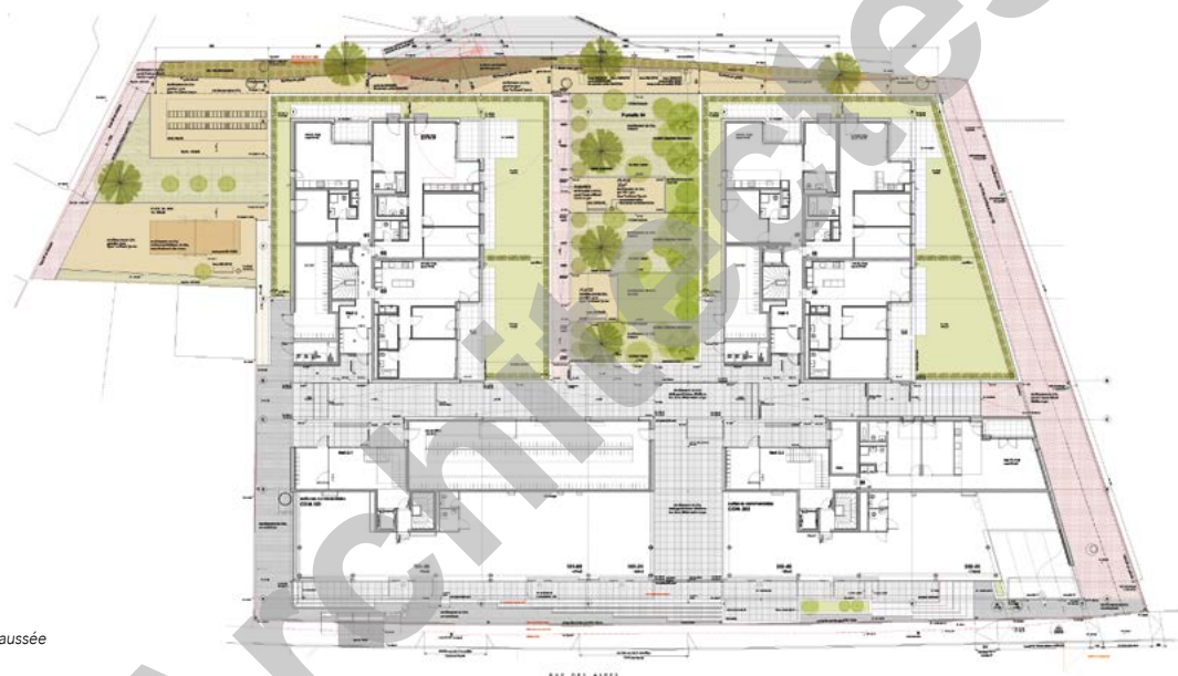
Plan du rez-de-chaussée